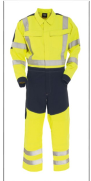
Model 5062 88

Daarnaast voldoet de overall aan de zichtbaarheidsnormering EN ISO 20471. Mail ons gerust voor meer informatie en/of een prijsindicatie.