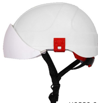
H058S-2 ARC-E25 24 cal/cm 2

Mail ons gerust voor meer informatie: sales@tranemo.nl .